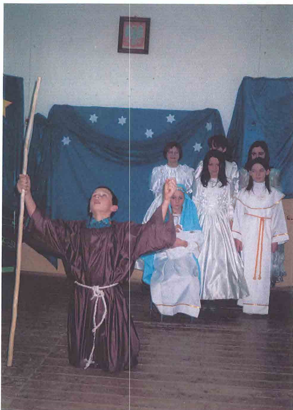
Jasełka w szkole w Polkowie.