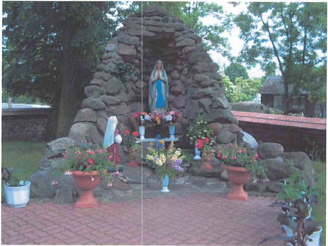
Kaplica Matki Bożej na cmentarzu kościelnym