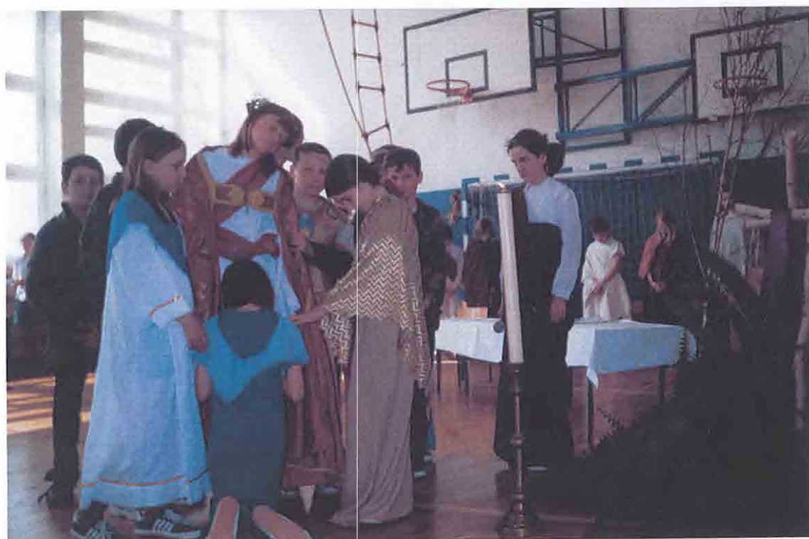
Misterium Męki Pańskiej – inscenizacja w szkole w Grębkowie (IV.2004 r.).