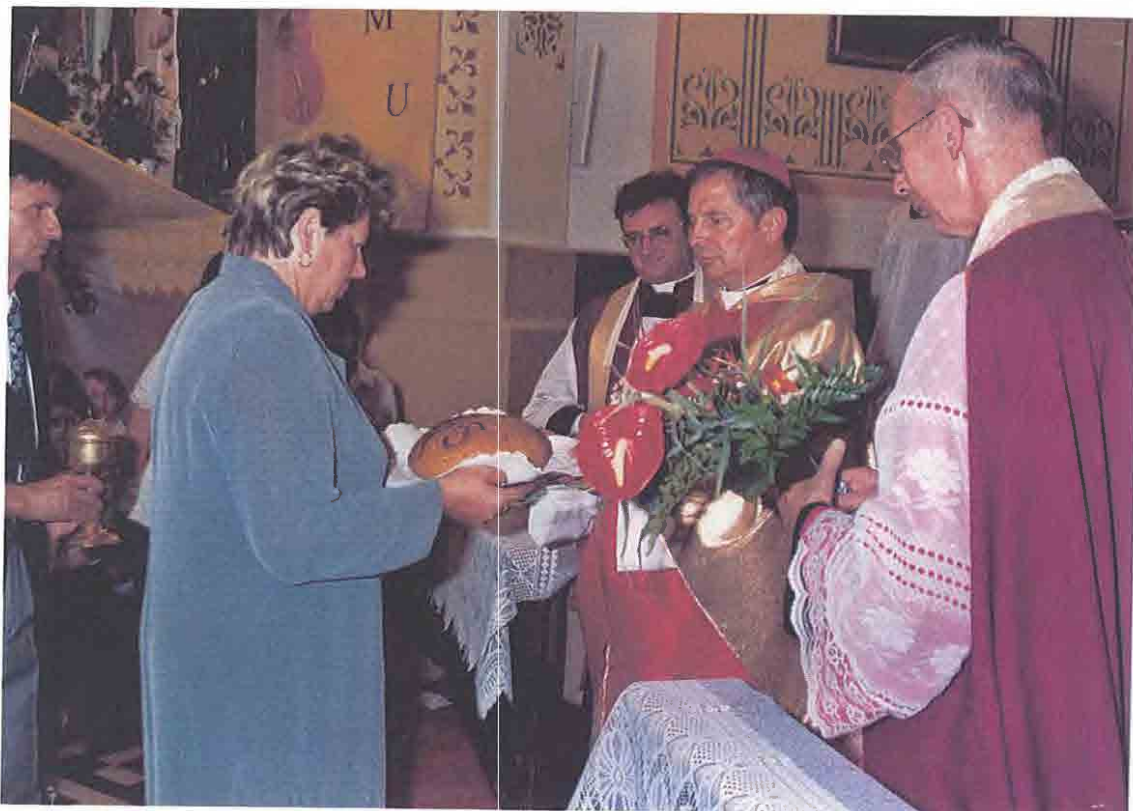
Stulecie konsekracji kościoła w Grębkowie.