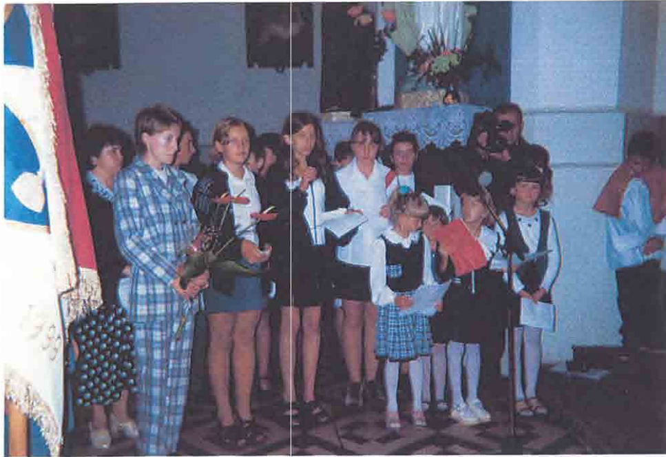
Msza z okazji otwarcia nowej szkoły w Grębkowie.