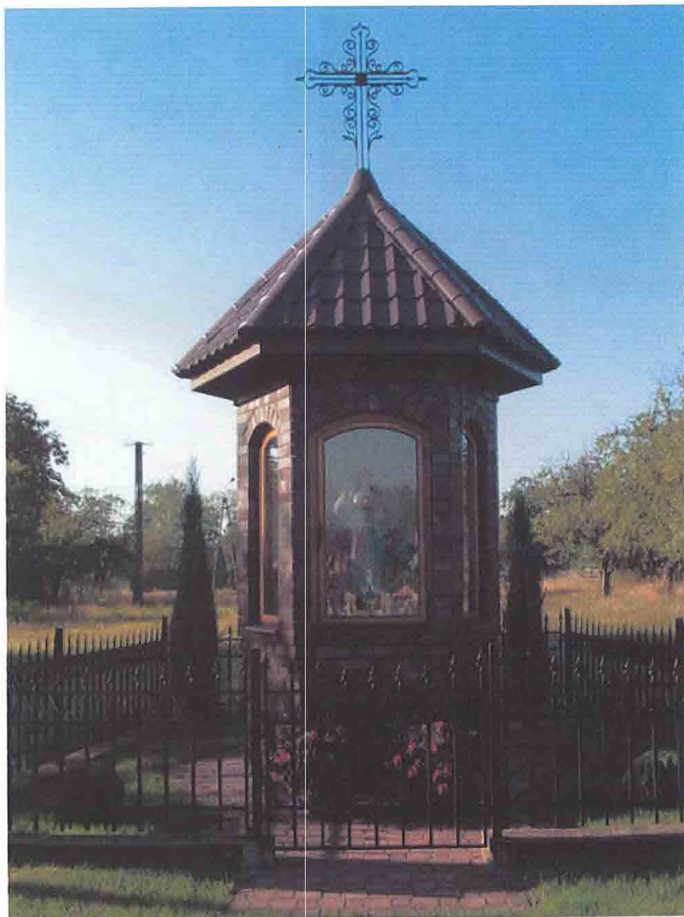
Kapliczka Miłosierdzia Bożego we wsi Żarnówka.