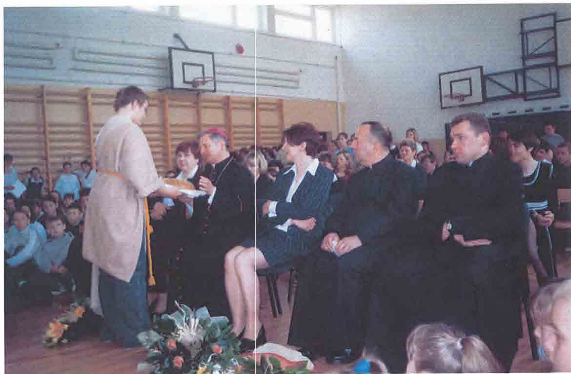
Wizytacja kanoniczna bpa Henryka Tomasika w gimnazjum w Grębkowie (IV.2004 r.).