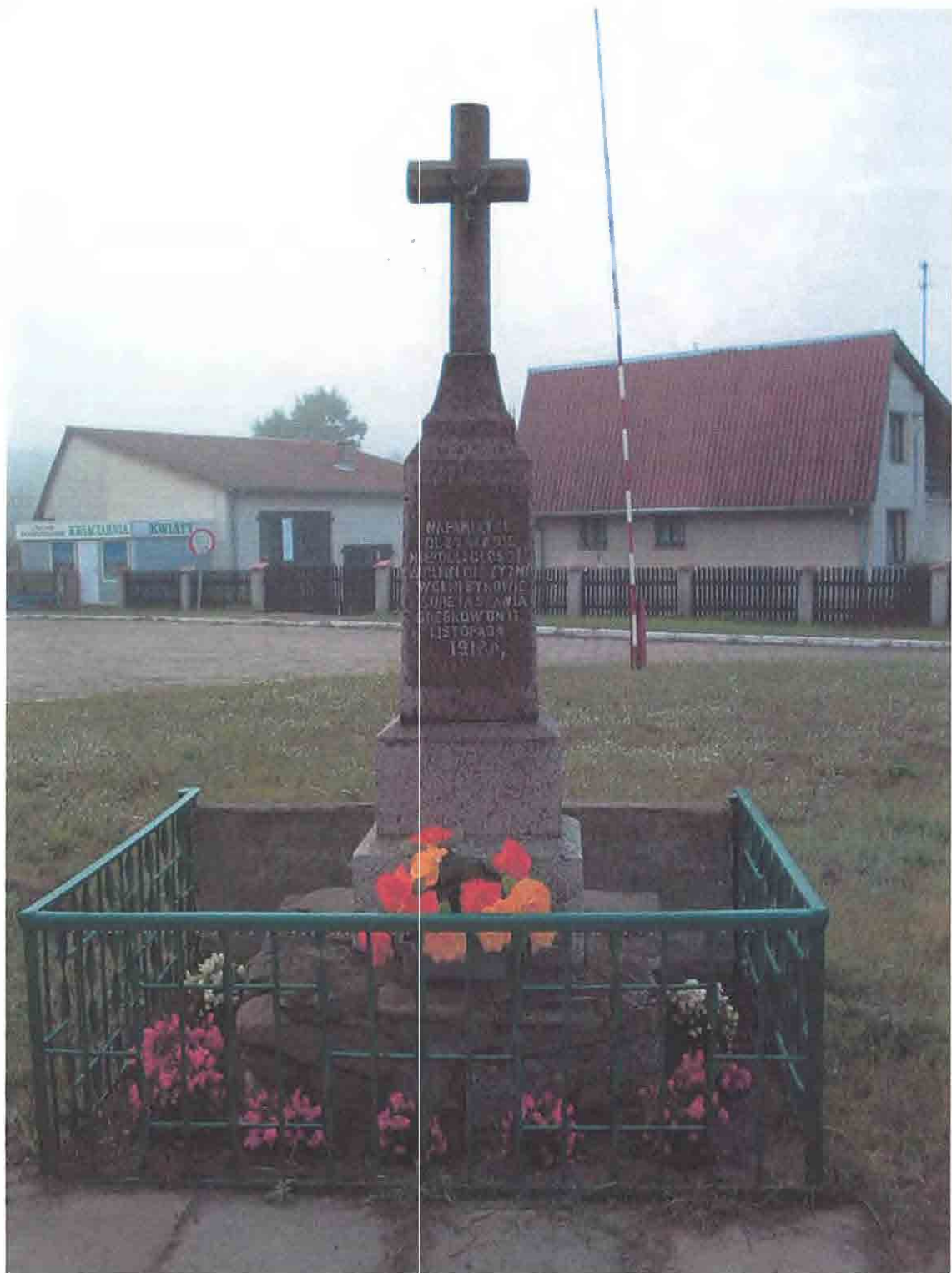
Krzyż w Grębkowie upamiętniający odzyskanie niepodległości w 1918 r.