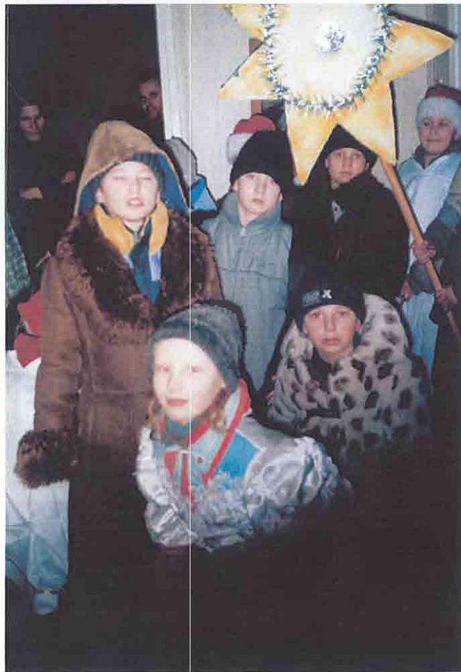
Kolędnicy misyjni odwiedzają rodziny w Grębkowie.