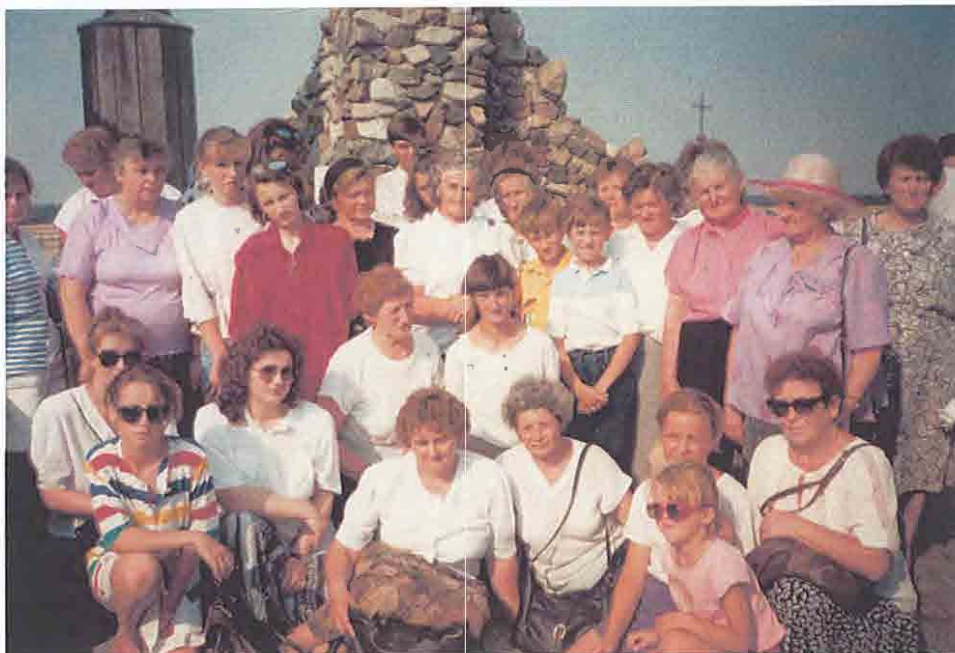
Pielgrzymka do Lichenia.