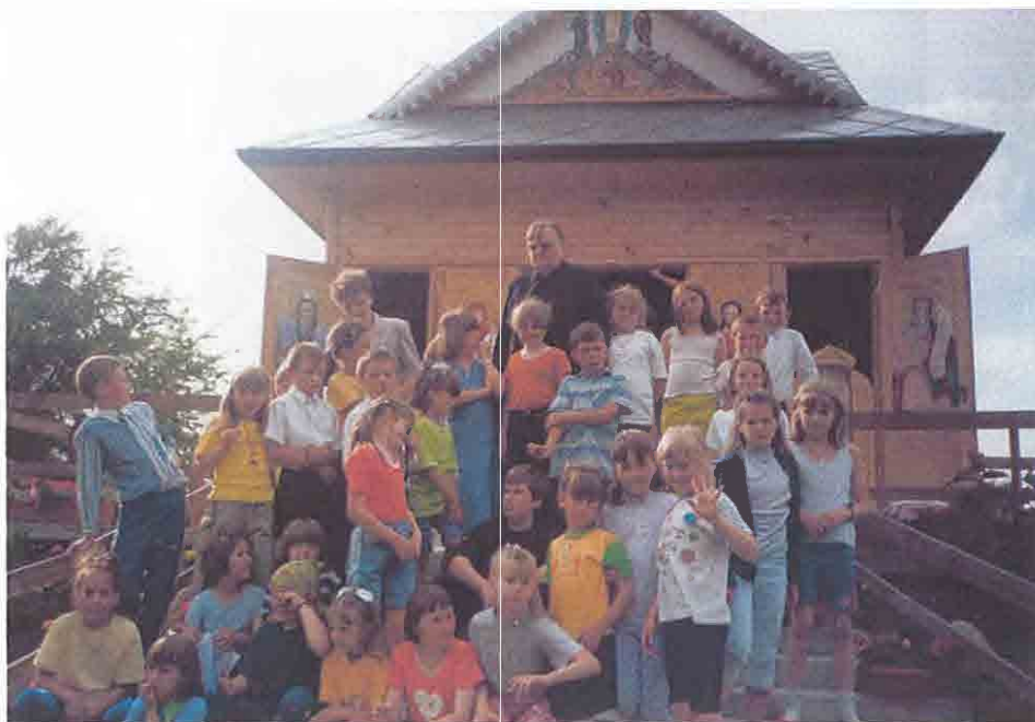
Pielgrzymka do parafii unickiej w Kostomłotach.